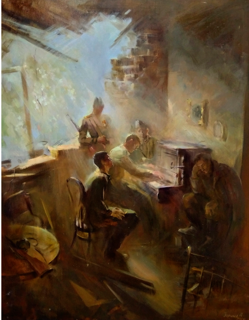
Зорина А. «Венский вальс» 2000 г.