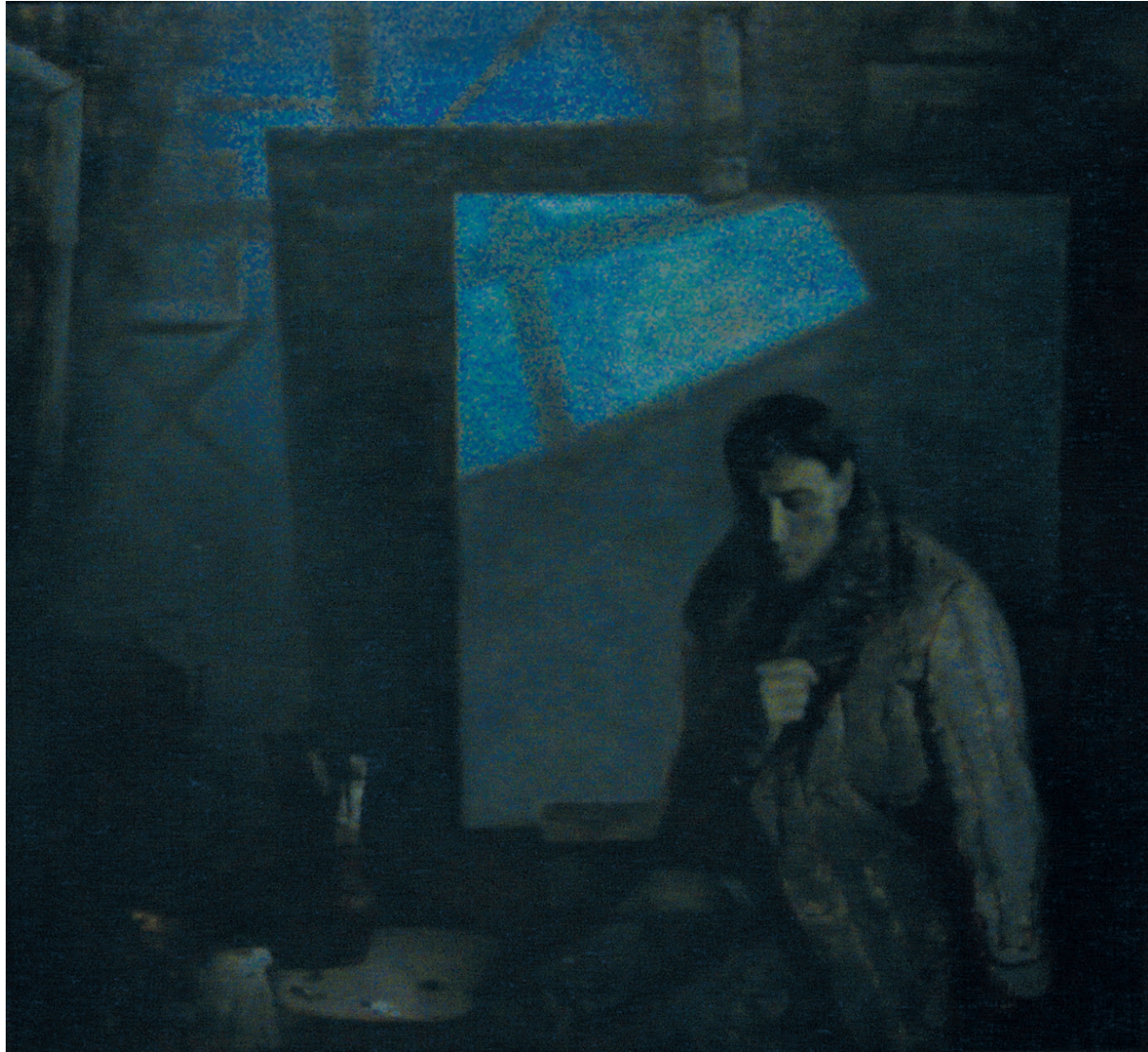
Синицина М. «Декабрь 42-го» 2016 г.