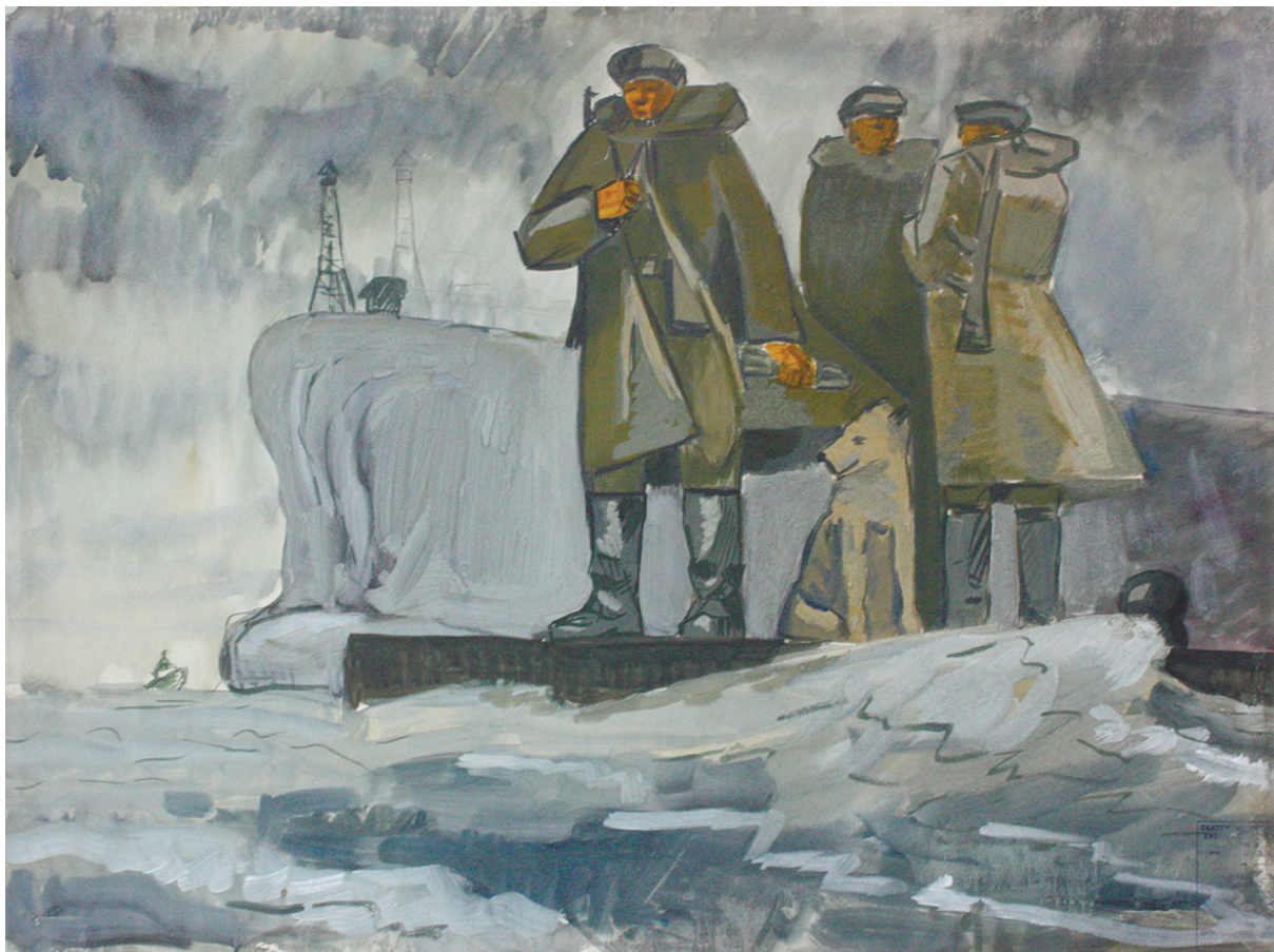
Автор неизвестен «Эскиз композиции»