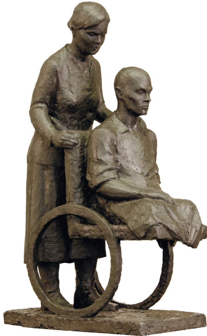
Селезнёв Н. «Мать и сын» 2010 г.