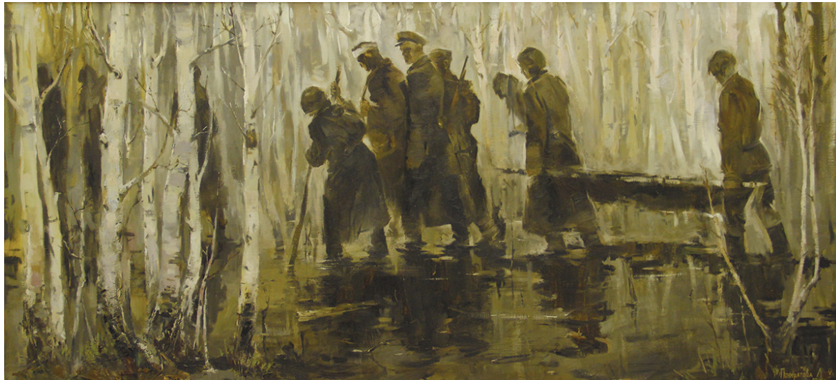
Панкратова Е. «Из окружения» 2000 г.