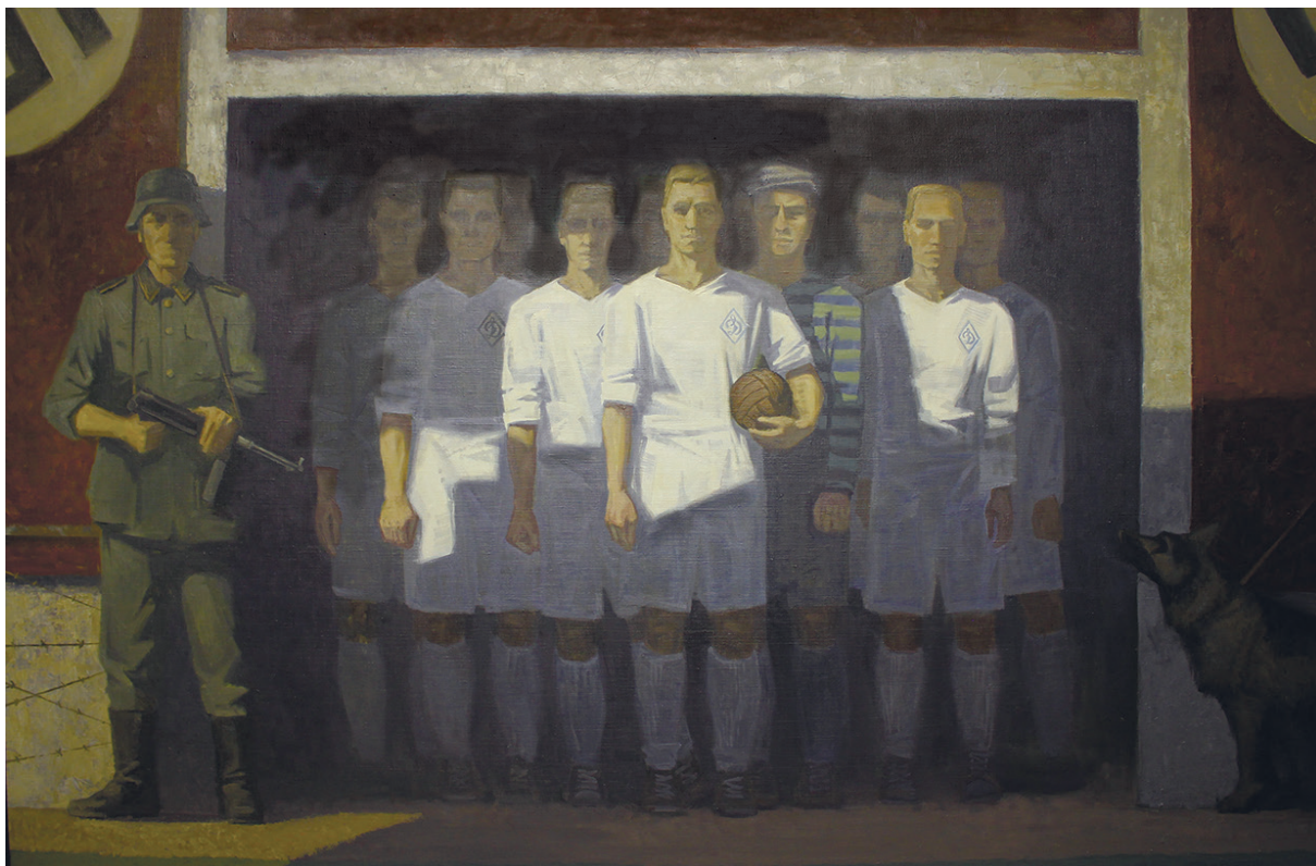
Бушмакина М. «Ставшие легендой» 2015 г.