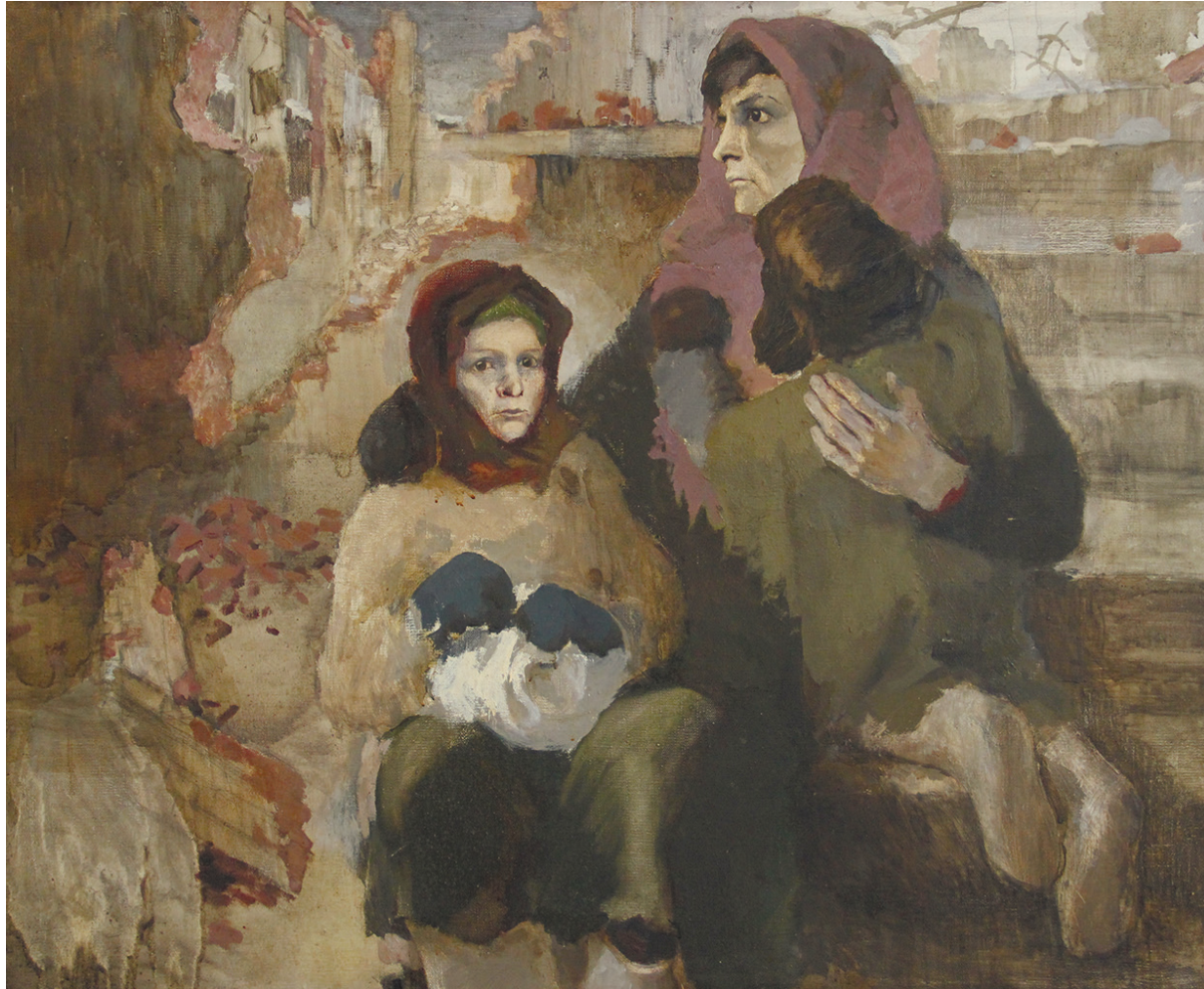
Панфилов В. «Ленинградцы» 1985 г.