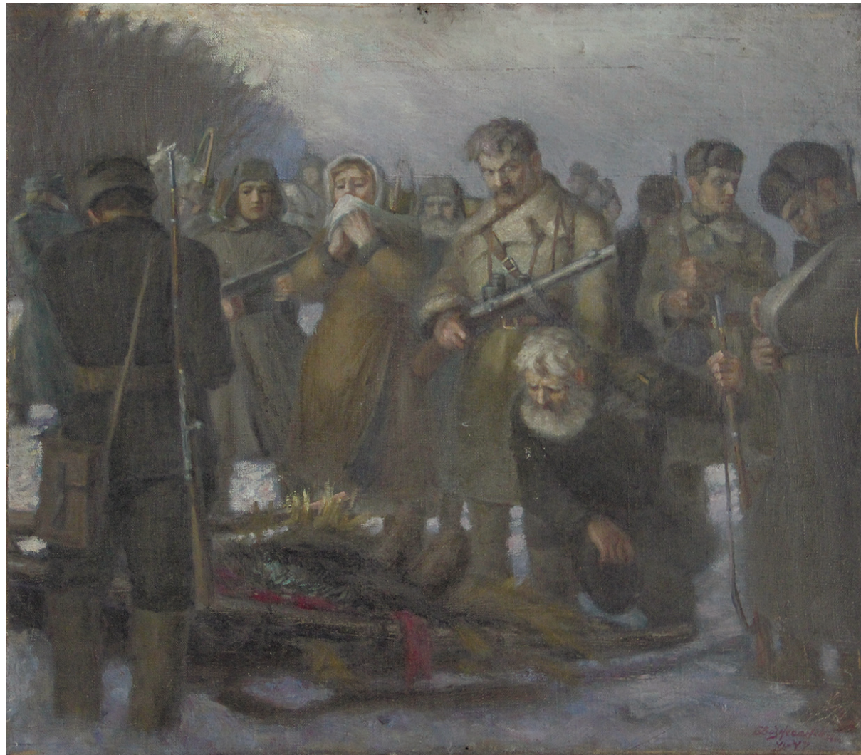
Вознесенский Б. «Партизаны» 1947 г.