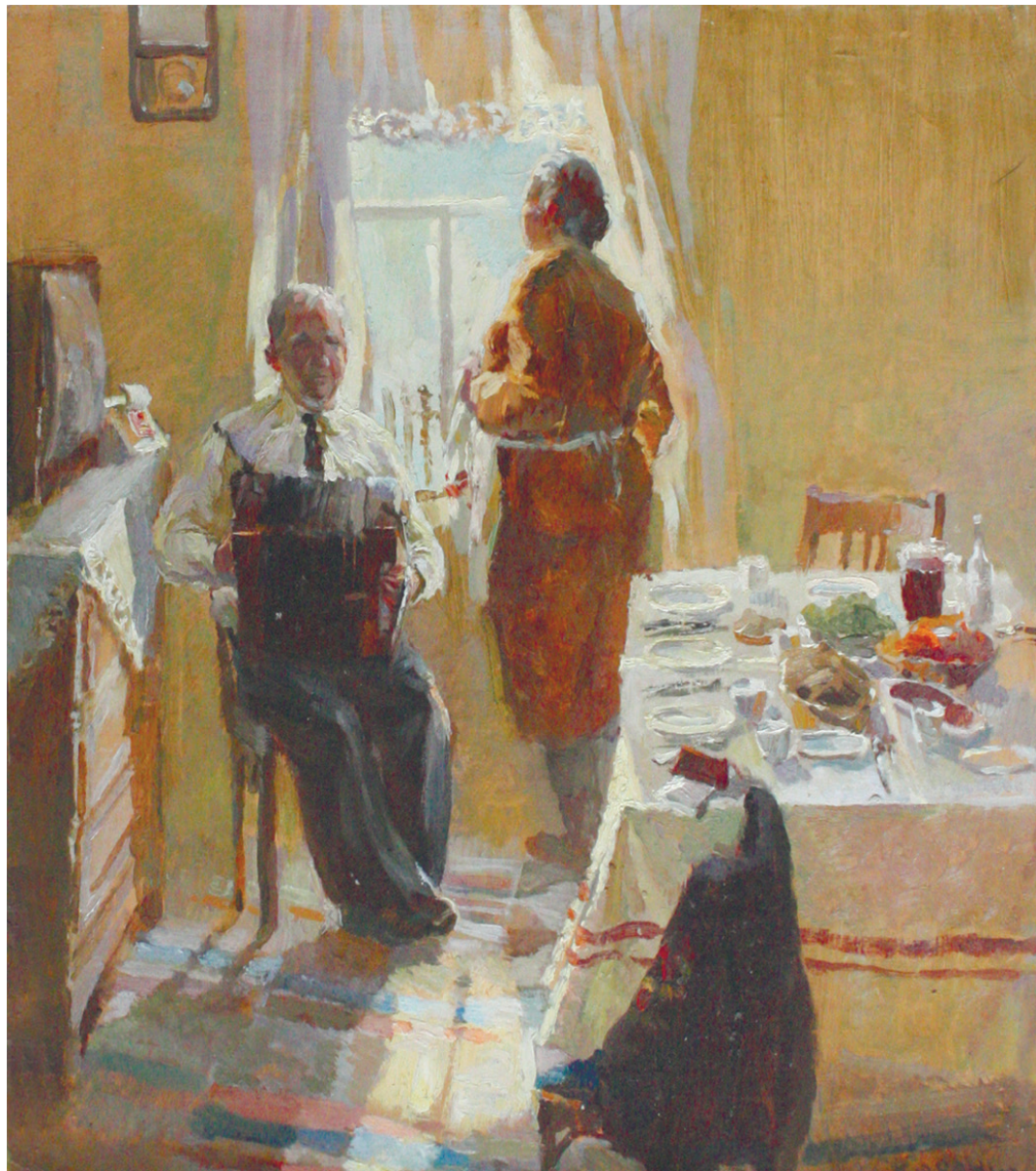
Косенкова М. «Композиционный этюд» 1995 г.