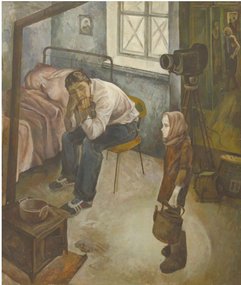
Ильина Г. «Трудные съёмки» 1987 г.