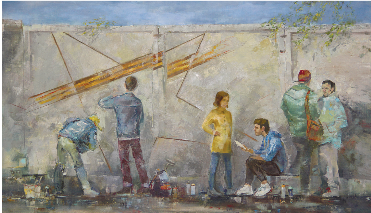
Мартюшева Я. «Стрит-арт» 2015 г.