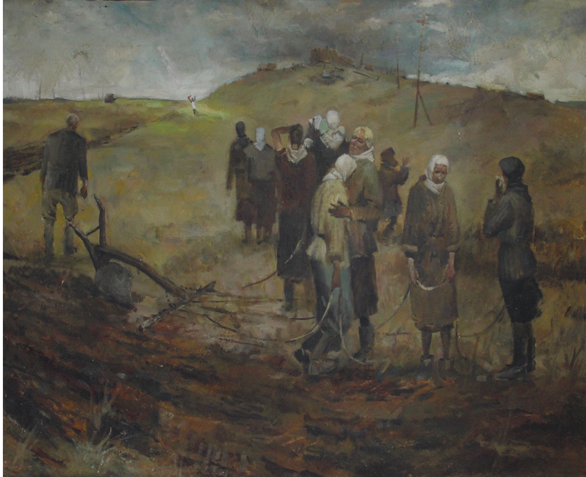
Богомолов О. «Победа» 1986 г.