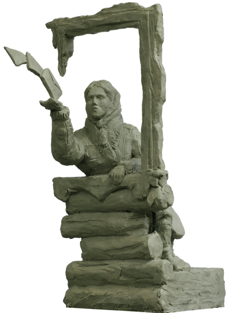
Елдашова Е. «Письма на фронт» 2015 г.