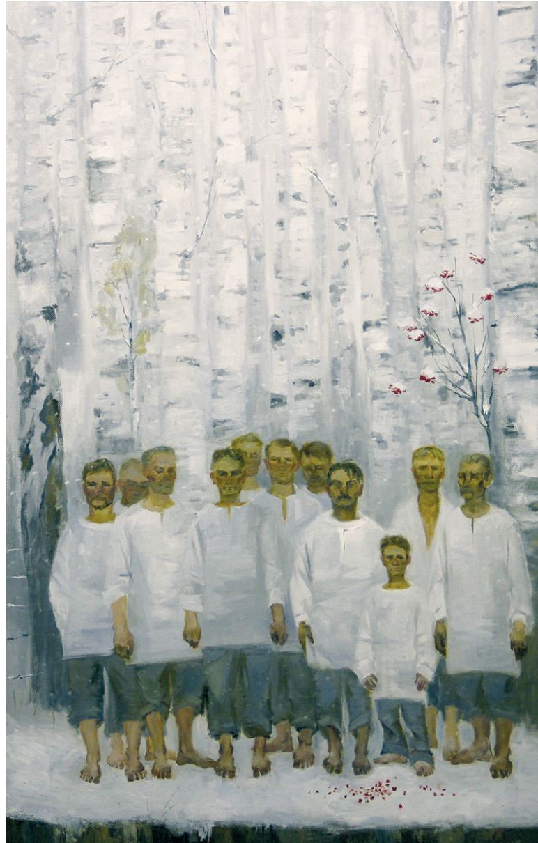
Семерикова Д. «Белые берёзы» 2015 г.