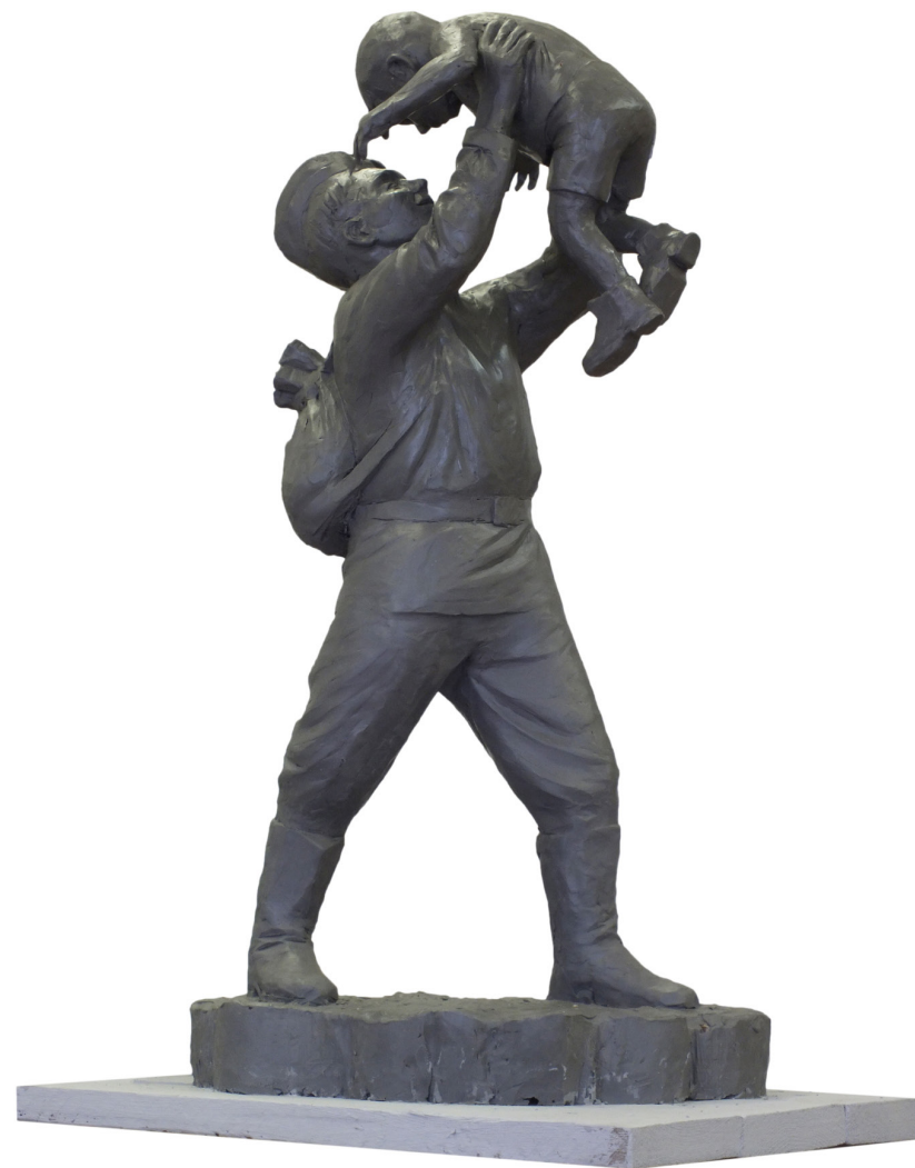
Ахмертдинов А. «Возвращение домой» 2015 г.